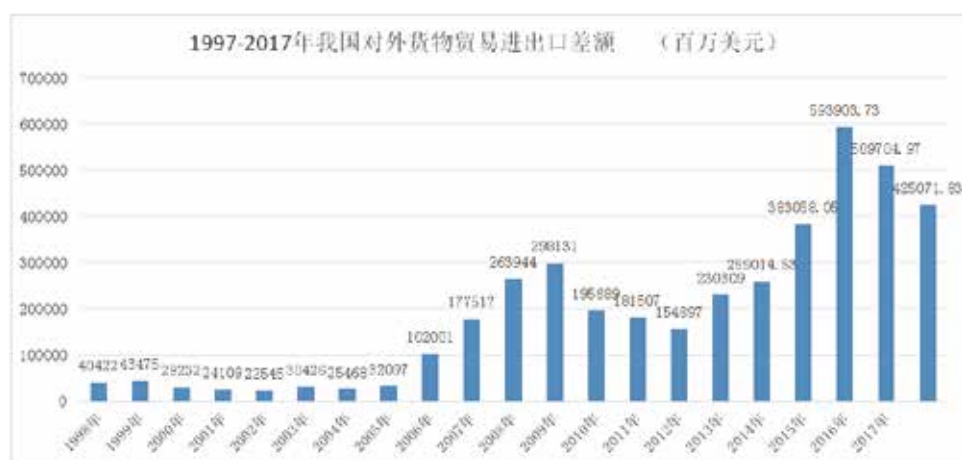
图 1：中国对外货物贸易进出口差额，1997—2017 年 单位：百万美元

进口增长将有助于推动我国对外贸易实现整体均衡发展，进口博览会对进口贸易增长的拉动起到有力助推作用。近年来，中国内需经济长期保持两位数增长，是支撑中国进口增长的强大动力。据估计，中国未来五年将进口超过 10 万亿美元的商品和服务，为世界各国企业进入中国大市场提供历史性机遇。 1 与此同时，随着对外投资过程中产生的贸易替代效应，中国出口增速相对放缓，进而有助于实现对外贸易整体均衡。受进口增长和出口替代的影响，自 2015 年货物贸易进出口余额达到顶峰后，进口增速已逐渐超越出口增速，进出口余额开始出现显著收敛迹象（图 1）。